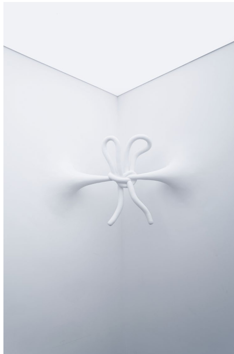
Bruno Figueiredo ©

But the three is first of all what separates and